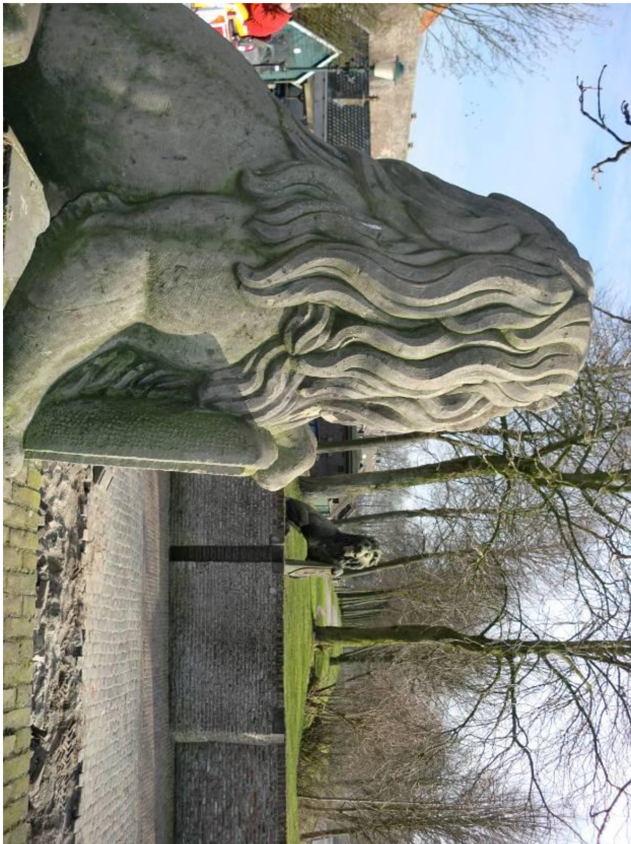
Leeuwen Elburg 2011