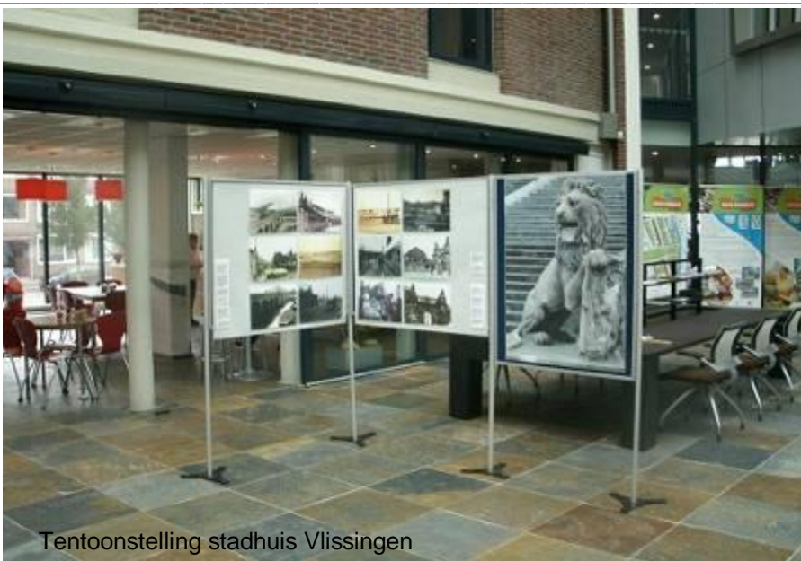
Tentoonstelling stadhuis Vlissingen