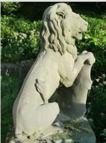
Uiterlijk kleine leeuw

De 6 kleinere leeuwen stonden op het spoorviaduct over de Korte Prinsengracht op de hoek met de Haarlemmer Houttuinen. Hier vertrokken ze in de 20-er jaren.