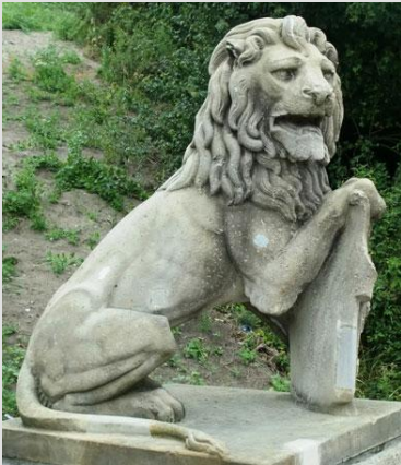
Uiterlijk grote leeuw

De 16 grote leeuwen stonden direct naast het Amsterdamse Stationsgebouw. Daarvan 8 op spoorviaduct Oostertoegang en de andere acht op de Westertoegang. Omdat het spoor breder moest worden, verdwenen de leeuwen. Die op de Westertoegang in 1904 en 1910. Op de Oostertoegang vertrokken er vier in de 20-er jaren; de laatste vier in 1969.