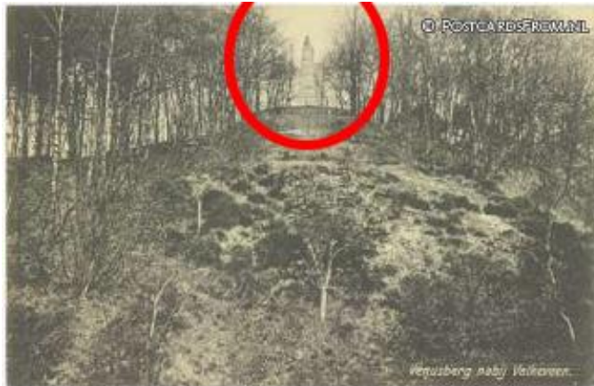
leeuw op zuil op de Leeuwenberg te Valkeveen

landgoed Graeffenveld. De toenmalige bewoner, de Amsterdamse burgemeester Andries de Graeff (1611-1678), verfraaide de Venusberg door er een zuil van zo'n 20 meter hoog op te zetten. Daar bovenop kwam een leeuw. Het schild dat de leeuw met zijn poten vasthoudt, draagt het