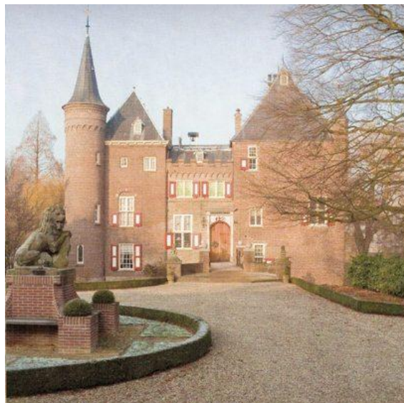
slot Well (gemeente Maasdriel)

In april 2010 werd de 15 e leeuw teruggevonden in de tuin van Slot Well. Deze waterburcht staat langs de Maas in de Gelderse gemeente Maasdriel,