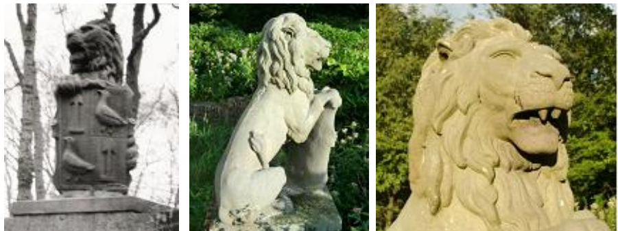
valse leeuw op de Leeuwenberg in Valkeveen 2010

De bewoner van de villa wees ons de Leeuwenberg, aan het einde van een strak geschoren gigantisch gazon, in zijn tuin met de allure van een park. We baanden ons een weg door een verwilderd struikgewas en kwamen via een eeuwenoude stenen trap op de top van de Leeuwenberg. Deze berg is overigens in werkelijkheid een flinke heuvel van een meter of 20 hoog. We zagen het meteen: dat is een valse leeuw! Het beeld was niet groter dan 90 cm. De CS-leeuwen zijn bijna tweemaal zo groot. Alléén daarom al is het een valse leeuw. Bovendien lag zijn staart niet op de grond maar omhoog gebogen. Bovendien kan deze leeuw ook vanwege de ouderdom van het beeld (het dateert uit de 17e eeuw en is dus meer dan 300 jaar oud) niet tot onze leeuwenroedel behoren. Onze leeuwen dateren van 1875.