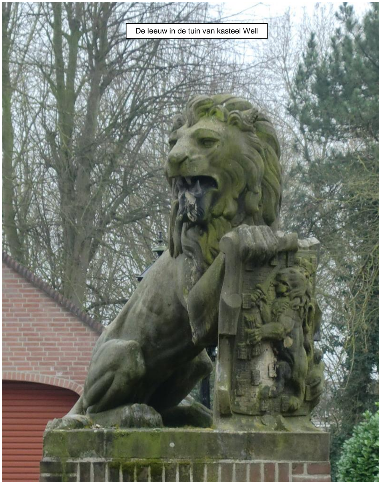
De leeuw in de tuin van kasteel Well