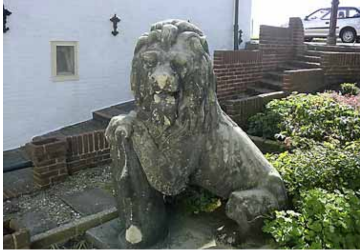
De leeuw in Schellingwoude bleef in de familie.

Volgens Mooij vallen de klappen overal in de organisatie onder jong en oud, man en vrouw. Jongeren zijn wel ondervertegenwoordigd: de gemiddelde ambtenaar is 48 jaar oud.