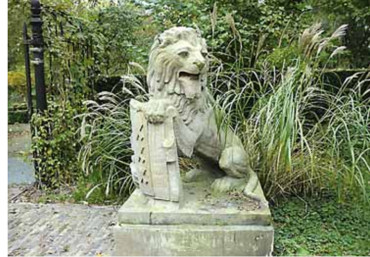
Leeuw bij het Beatrixpark.