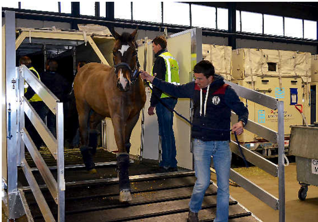
Paarden worden uit de speciale containers geladen en naar de stallen gebracht.

Het probleem is dat KLM Cargo al jaren wacht op nieuwbouw aan de overzijde van de Kaagbaan. „In de tussentijd zie je dat klanten uitwijken naar Duitsland, Luxemburg en Frankrijk waar ze betere faciliteiten voor paarden hebben. Transitieverkeer zie ik al helemaal niet meer op Schiphol omdat de paarden hier niet kunnen wachten op een aan-