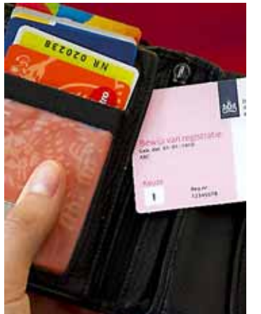
Donorcodici.