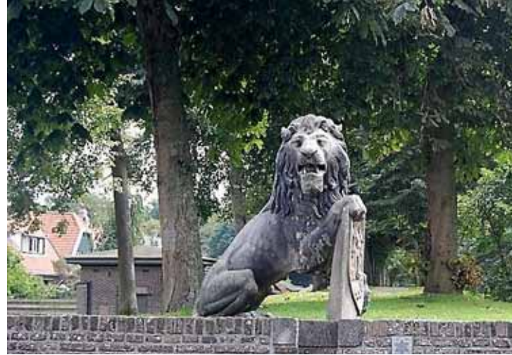
Leeuw in Elburg.