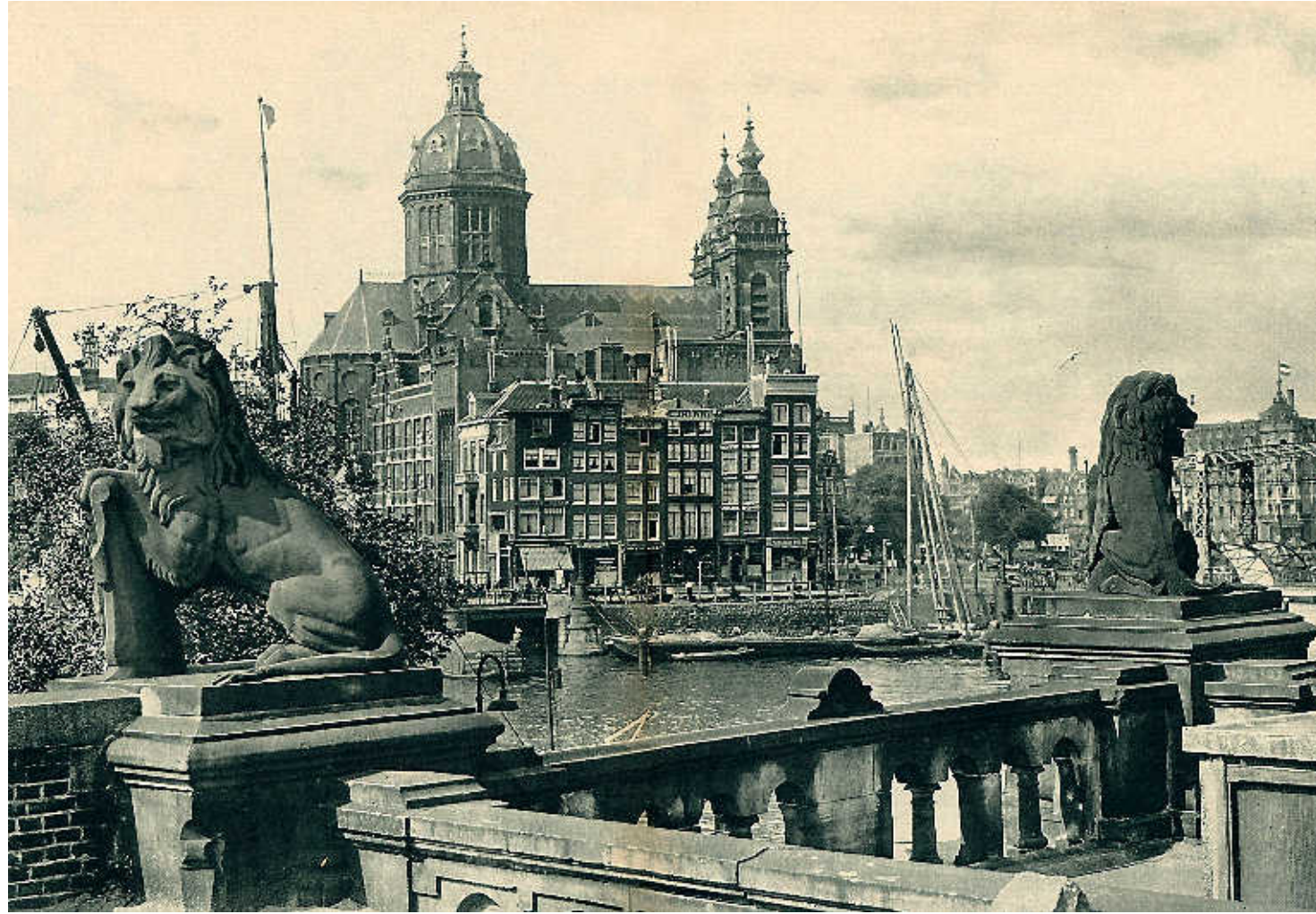
De koning van de jungle waakte over de reizigers. Hier met uitzicht op de Nicolaaskerk.

Vijftien beelden zijn inmiddels teruggevonden. Die staan in Vlissingen, Elburg, Maarsse, Valkeveen (klein beeld), Den Haag, Maasdriel, Amstel-