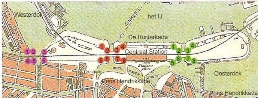
Plattegrondje met alle 22 leeuwen, gemaakt door Theo van Baarsen.

De leeuwen bij de Westertoegang en de Oostertoegang stonden er in ieder geval al in het voorjaar van 1877, blijkt uit opna-