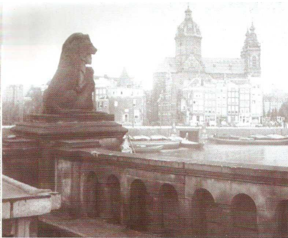
Op de ballustrade van de Oostertoegang stond een leeuw als 'wachter van Amsterdam'. In de verte (v.l.n.r.) de ingang van de Oudezijds kolk, de Schreierstoren en de Sint-Nicolaaskerk.