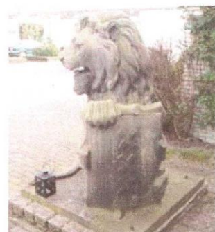
Leeuw in Amstelveen