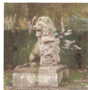
Wakers en Wachters?