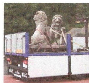
Renovatie Vlissingse leeuwen.

Waarschijnlijk hebben de organisatoren van de Floriade in 1972 zich niet afgevraagd of er in het Beatrixpark bij de Artsenijhof en de RAI nu wakers of wachters moesten staan.