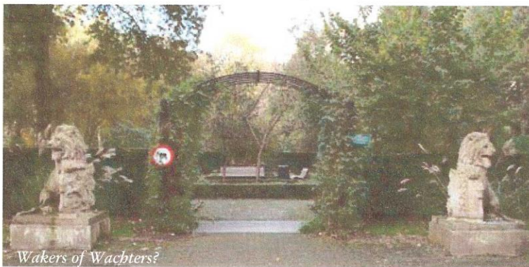
Wakers of Wachters?

Doeke Roos jr. uit Vlissingen, degene die al jaren geleden veel feiten verzamelde over de zwerftocht van de 16 leeuwen bij het Centraal Station in Amsterdam, is ook nu weer enthousiast geworden naar aanleiding van ons artikel. Via een oproep in de Telegraaf van 2 december 2008 kreeg hij heel wat reacties, waarvan er vooral één een schot in de roos bleek. Daarvan deed de Telegraaf op 9 januari 2009 verslag.