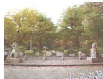
Leeuwen bij de toegang RAI.