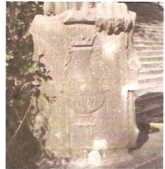
Vlissingse fles, gehakt uit het Amsterdamse stadswapen.

Komt broeders, bergen wij het vege lijf.