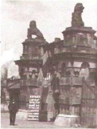
Centraal Station vanuit het oosten gezien, mei 1894.