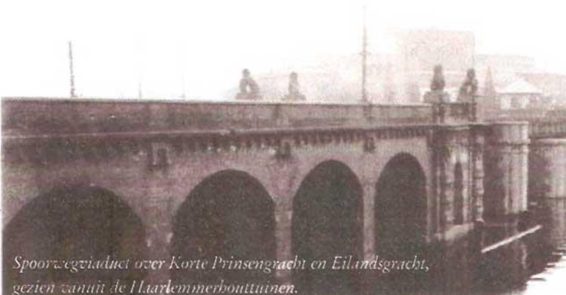
Spoorwegviaduct over Korte Prinsengracht en Eilandsgracht, gezien vanuit de Haarlemmerbouwtuinen.