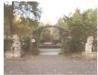
Leeuwen bij de Artsenijhof.

Een specialist van de Rijksdienst voor Monumentenzorg stelde vast dat de leeuwen zijn gemaakt van "Oberkirchner zandsteen". Deze steen werd ooit gewonnen in een groeve in de buurt van Oberkirchen in Duitsland. Ook in het Vredespaleis in Den Haag en het stadhuis in Leiden is dezelfde steen verwerkt. Het grove voorhakerwerk bij het maken van beeldhouwwerk werd vaak gedaan door zogenaamde uitvoerders. Door middel van een punteerapparaat, maar ook met passers, werd een vorm in gips exact overgebracht in steen. Dat verklaart waarom de verschillende beelden zo gelijk zijn aan elkaar. De Vlissingse fles op een van de leeuwen is waarschijnlijk later gebeiteld uit de drie Amsterdamse Andreaskruizen die in hoog reliëf waren uitgevoerd en met wat